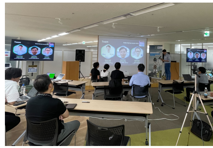
集合研修のイメージ