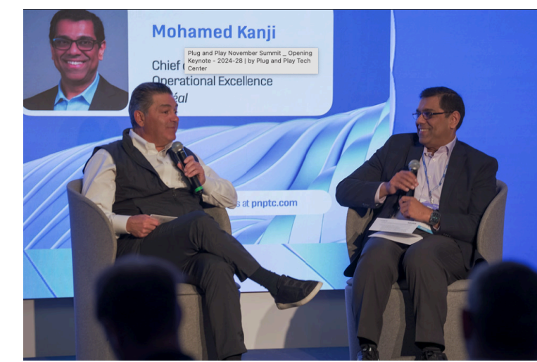
Plug and Play Silicon Valley SUMMITの様子